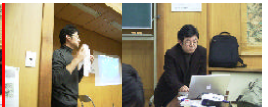
向島アートアーカイブプロジェクト【トリのマーク、田中】