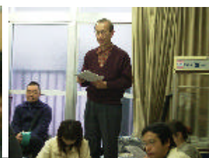
向島学会 2006年度 第4回交流のサロン