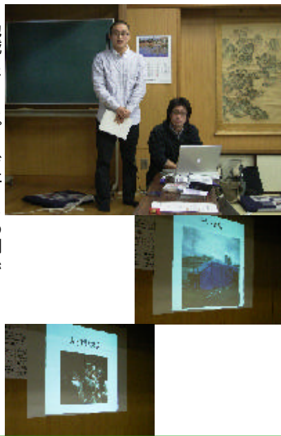
地域とアートプロジェクトの関係

会場からは、「新東京タワー」を機にいろいろな人が地域に入ってくるなかで、地元地域としても積極的にいかつ規律を持って迎えることの大切さが語られました。