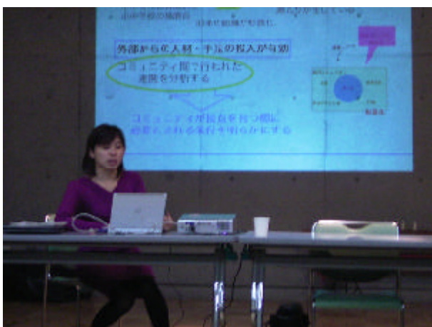
子どもを対象とする地域プロジェクトを介した多層コミュニティ間の連携

若いお二人の「和」の演奏に、ちよつと年齢の高い方々も大いに盛り上がりました。下町の多層間コミュニケーションです。